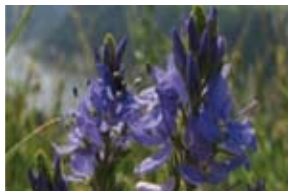
Ähriger Ehrenpreis/spiked speedwell

rare, the species of animals and plants that can be found here are protected by German and European Nature Protection Laws, e.g. “Guidelines for the protection of fauna and flora habitats (FFH-RL)“. Many of these special animals and plants can be observed here.