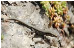
Mauereidechse/common wall lizard