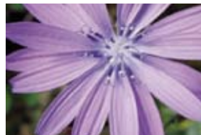
Blauer Lattich/blue lettuce